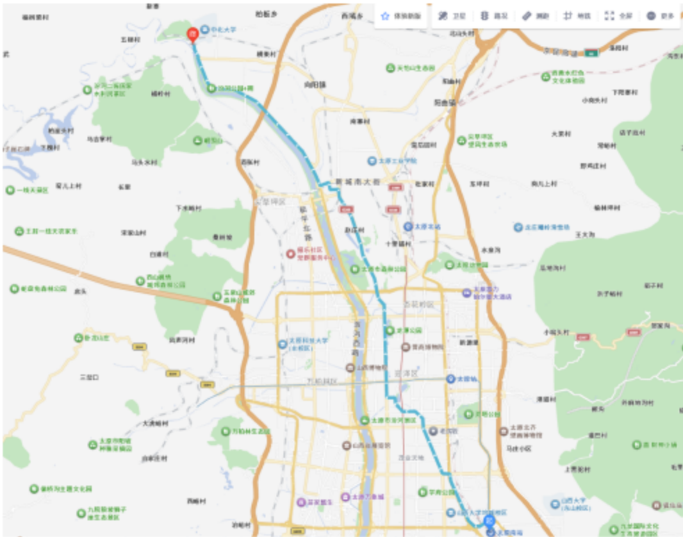
图 1 太原南站到中北大学南门