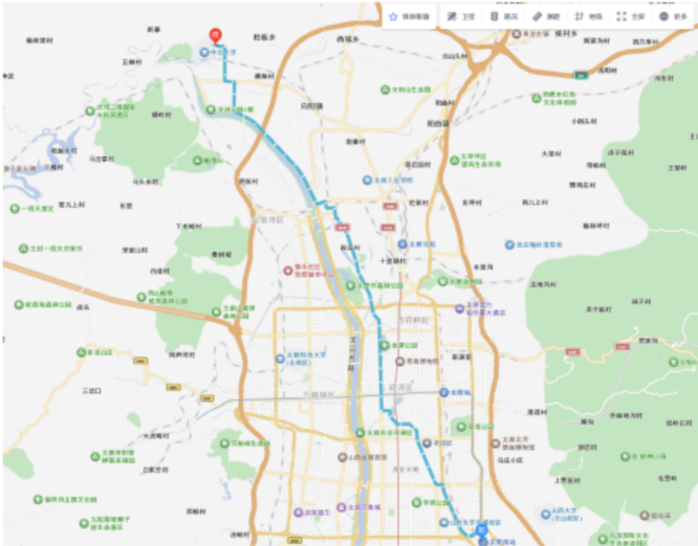
图 3 太原南站到中北大学东门