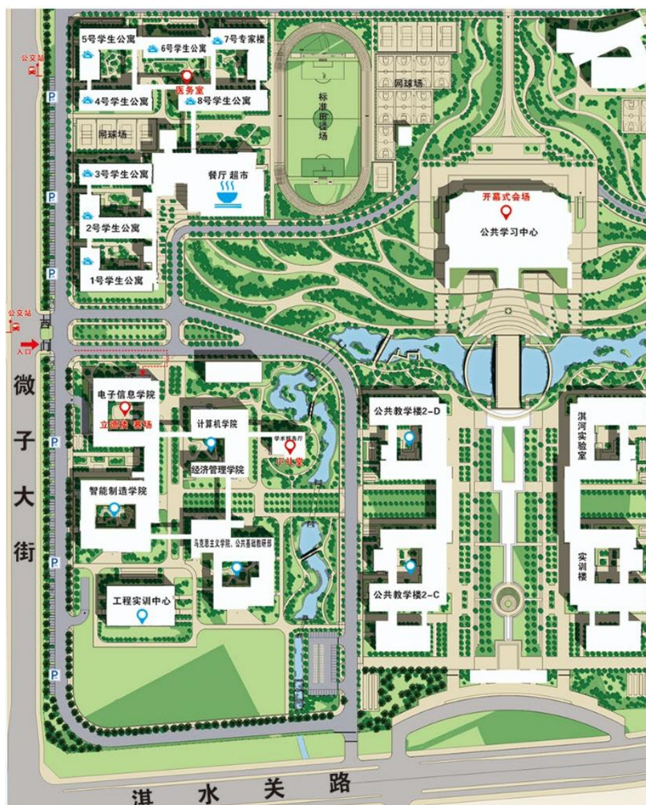
河南信息科技学院筹建处（河南理工大学鹤壁工程技术学院）校区平面图

六、注：所有参赛队员信息已在校保卫处备案，到达校区西门后，说明来访事由，出示胸卡，签字确认即可进校。