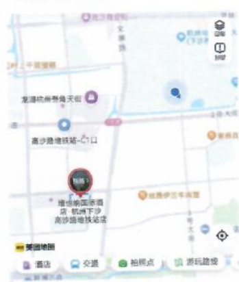
维也纳国际酒店·杭州下沙高沙路地铁站店