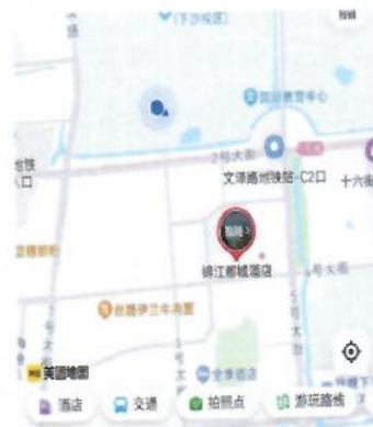
锦江都城酒店(杭州下沙大学城文泽路地铁站店)