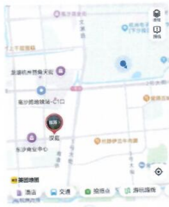
汉庭(杭州下沙大学城高沙路地铁站店)