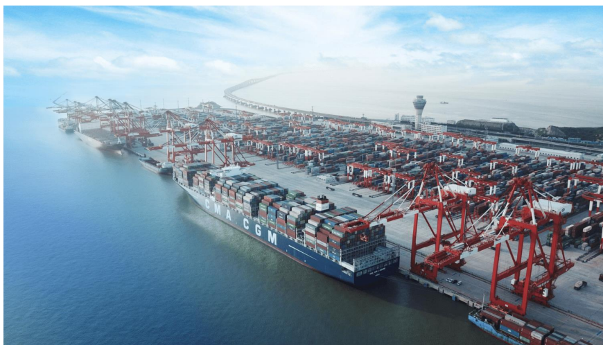
图 1 港口自动化码头

华南某国际集装箱码头有限公司预采购 10 台具备自动化及远程控制功能的轨道式双悬臂集装箱龙门起重吊（以下简称“轨道吊”）。轨道吊是用于在堆场与水平运输设备（传送带、汽车、小型轮船）之间的装卸集装箱的起重设备。如图 1 所示：