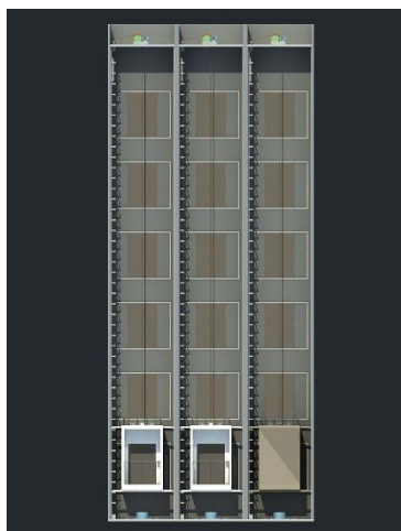
图 1：电梯模型外形示意图

电梯运动模型是以三维虚拟仿真的形式呈现，其主要包括：电梯整体（包括轿厢、电机、限位开关等）、各个楼层按钮（呼梯按钮及指示灯）、电梯内部设备（轿厢开关门按钮、轿厢选层按钮及指示灯等）。电梯模型采用多部多层结构，其外形及样例示意图如下所示：